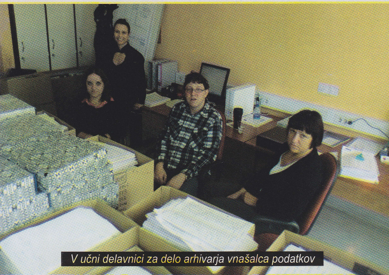
V učni delavnici za delo arhivarja vnašalca podatkov