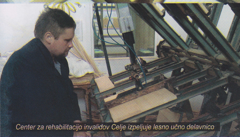
Center za rehabilitacijo invalidov Celje izpeljuje lesno učno delavnico