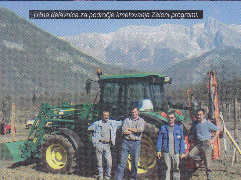
Učna delavnica za področje kmetovanja Zeleni programi.

Pomanjkanje primarnih in prilagodljivih programov usposabljanja ter zaposlovanja, ki bi upoštevali posebne potrebe invalidnih oseb in bi obsegali teoretično usposabljanje, prakso v prilagojenih razmerah in prakso v pravem delovnem okolju, je težava, s katero se srečujejo invalidne osebe. Učna delavnica je inovativen projekt, ki skuša to odpraviti in s triadnim usposabljanjem ponuditi širše možnosti za usposabljanje invalidov na konkretnih delovnih mestih.